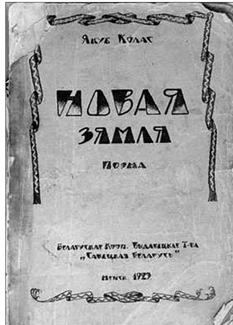
Вокладка першага выдання паэмы «Новая зямля». 1923 год.

Нашы ўдакладненні, аднак, не адмяняюць азначэння. Нягледзячы на аўтабіяграфізм паэмы, аўтар у яе рэалістычна-эпічным пласце не робіць цэнтрам сусвету сваю сям’ю ці – тым болей – сябе (прататыпа хлопчыка Костуся). Галоўнае ў паэме – жыццё селяніна наогул. Беларускага. Характэрнае, часам да банальнасці (кантэксту свайго часу) жыццё з адпаведнымі клопатамі. Прывядзём, напрыклад, словы Антона Луцкевіча: “...Дадзены Коласам абраз ёсць тыповы для ўсяго беларускага немажоняга сялянства” 8 . Такая тэза ўзнікла яшчэ пры жыцці паэта. Думка тыражуецца па сённяшні час у найбольш распаўсюджанай